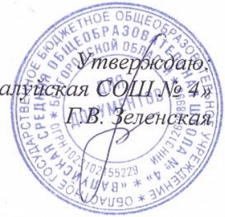
График выдачи продуктовых наборов за сентябрь 2023 года в ОГБОУ «Валуйская СОШ № 4»